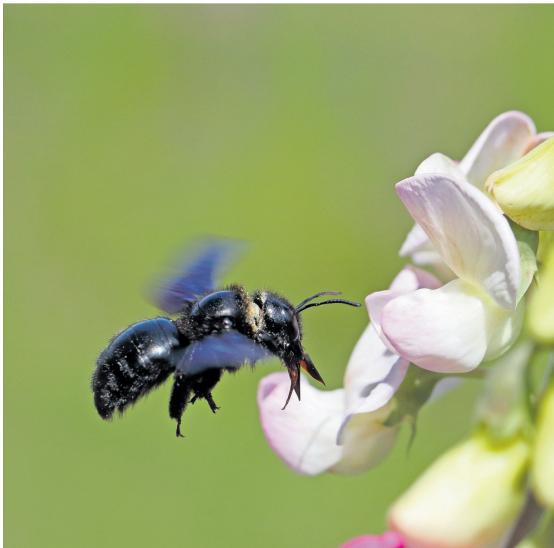
Wildbienen sind häufig spezialisiert auf bestimmte Pflanzen- oder Blütenarten.