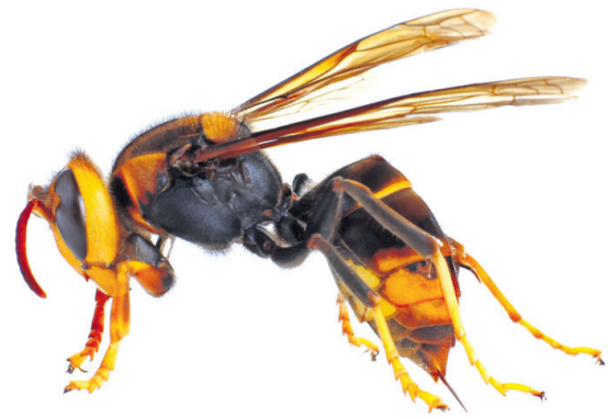
Ein Volk der Asiatischen Hornisse vertilgt rund elf Kilo Insekten im Jahr.